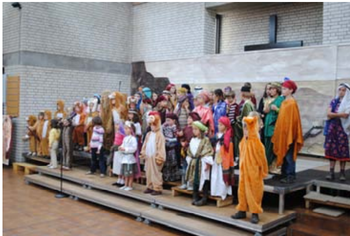
Singspiele der Kinder- & Jugendchöre Chor- & Orchesterkonzerte Konzerte externer Künstler